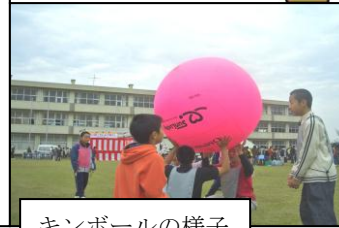
キンボールの様子