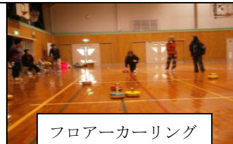
フロアカーリング

屋外の活動は毎月第3日曜日にグラウンドゴルフ大会を毎月開催しています。くぬぎの森スポーツ公園と中居運動場が会場です。